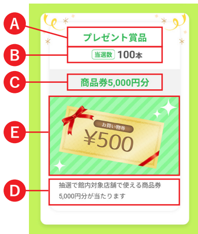
【 賞品一覧画像 】